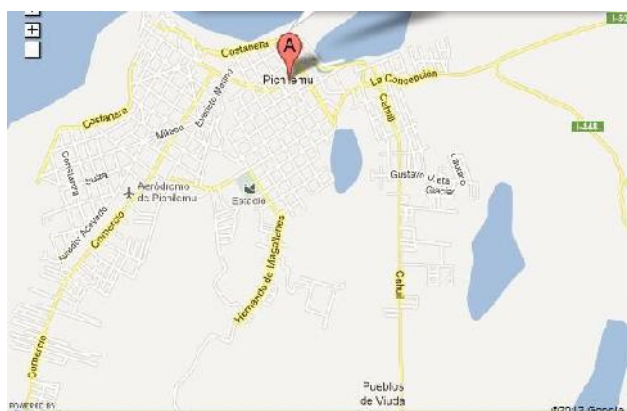
FIGURA 1: Mapa Comuna de Pichilemu

La comuna de Pichilemu es una de las seis comunas que conforman la provincia Cardenal Caro, de la cual es la capital provincial. Se encuentra ubicada en la Sexta Región del Libertador Bernardo O'Higgins, de significado, "Pequeño Bosque", en lengua Mapudungun, creada el 22 de diciembre de 1891, por la Ley de comuna autónoma de la que fuera autor don José Manuel Irrarrázaval Larraín, bajo el Gobierno del Presidente don Jorge Montt.