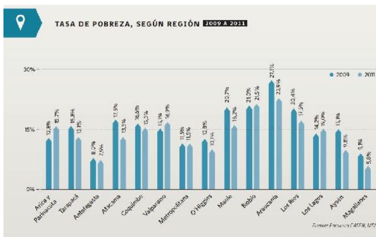
GRÁFICO N°1: Tasa de Pobreza, según región

En cuanto al nivel de pobreza, el número de personas de la comuna que se sitúa bajo la línea de pobreza es de un 17,6% y a nivel Regional 12,8%.