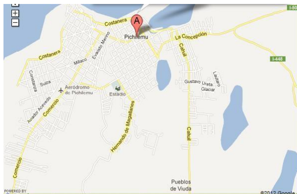
Mapa Comuna de Pichilemu

La comuna de Pichilemu es una de las seis comunas que conforman la provincia Cardenal Caro, de la cual es la capital provincial. Se encuentra ubicada en la Sexta Región del Libertador Bernardo O'Higgins, de significado, "Pequeño Bosque", en lengua Mapudungun, creada el 22 de diciembre de 1891, por la Ley de comuna autónoma de la que fuera autor don José Manuel Irrarrázaval Larraín, bajo el Gobierno del Presidente don Jorge Montt.