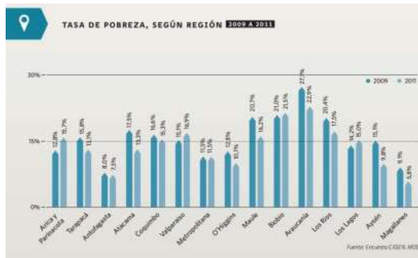
GRÁFICO N°1: Tasa de Pobreza, según región

En cuanto al nivel de pobreza, el número de personas de la comuna que se sitúa bajo la línea de pobreza es de un 17,6% y a nivel Regional 12,8%.